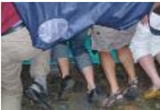
So sieht es vor und hinter den Kulissen aus ...