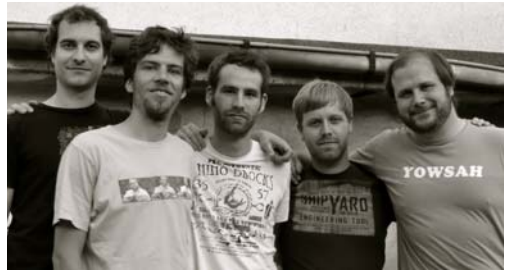
Do The Daktari (Afrobeat) Spielzeit: 21:05-21:50 Uhr

durch seine sprudelnde Direktheit jedes Publikum zum Tanzen bringt.